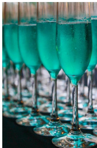
CVSTOS – LANCEMENT DE LA CHALLENGE SEA-LINER, CHEZ ATHLONIA, JAPON